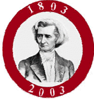
Hector BERLIOZ 1803 - 1869